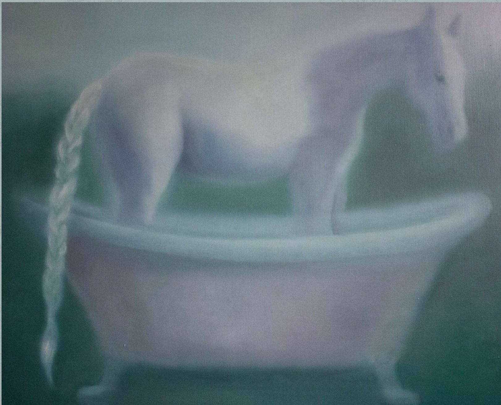
Safe space, 2025 olej na płótnie 80 x 100 cm