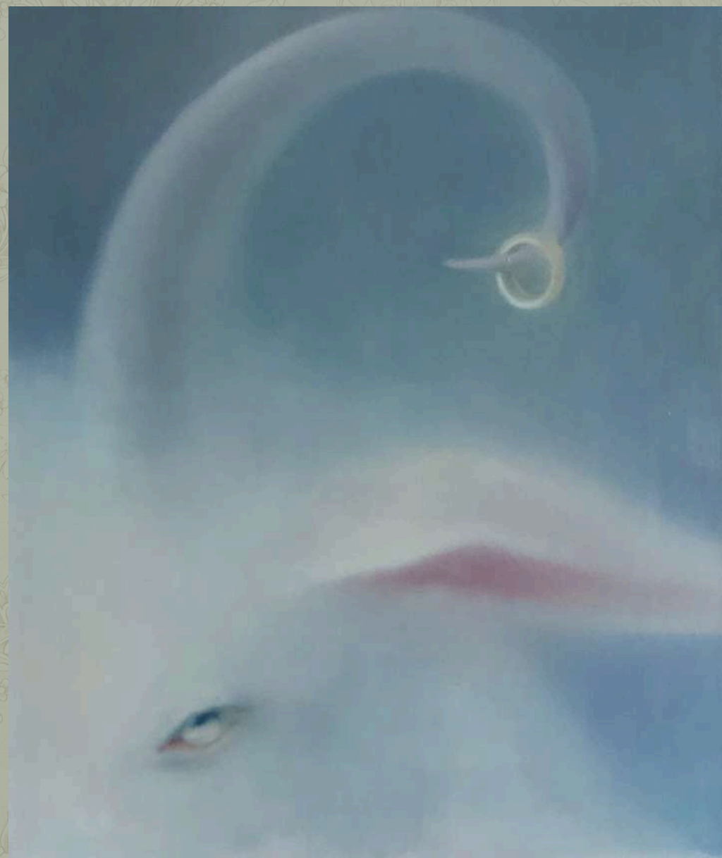
Bez tytułu, 2025 olej na płótnie 60 x 50 cm