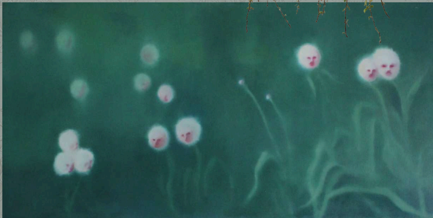
Bez tytułu, 2026 olej na płótnie 50 x 100 cm