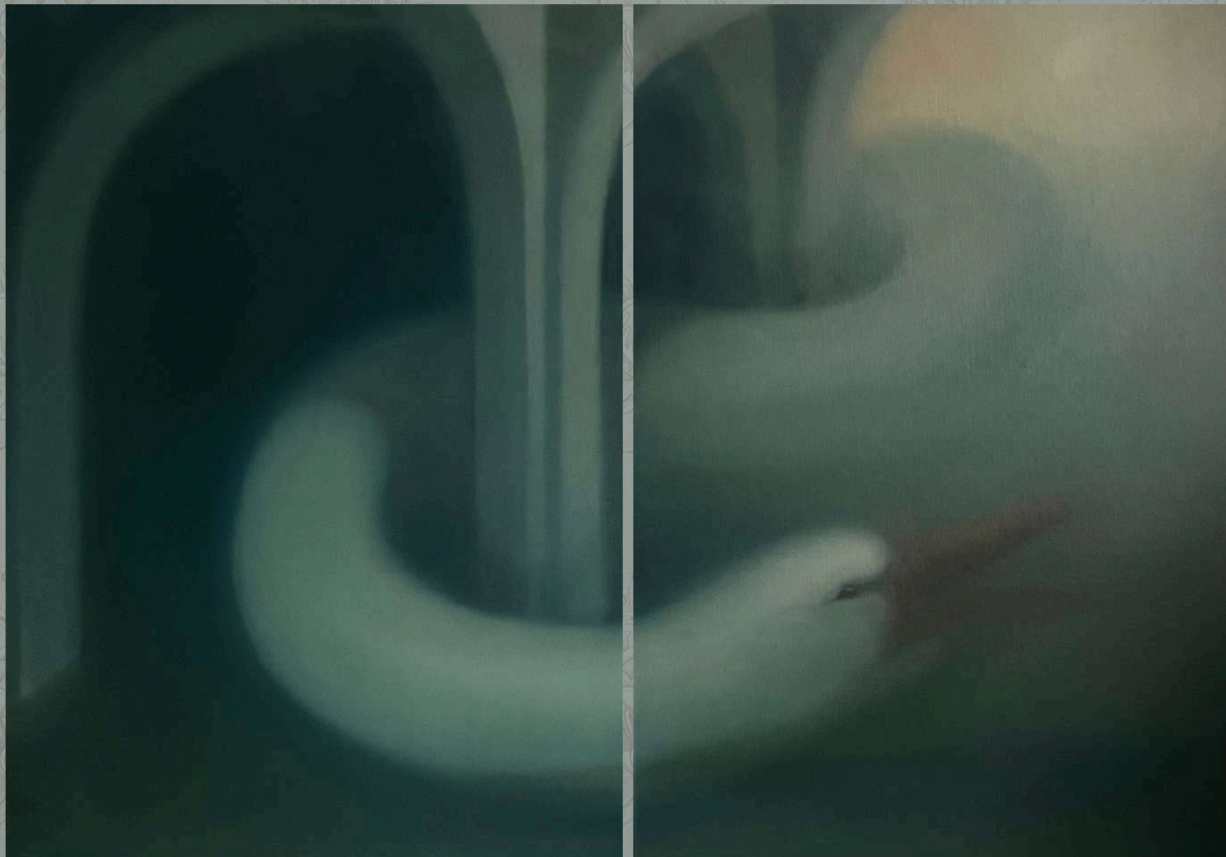
Trapped (dyptyk), 2025 olej na płótnie 100 x 140 cm