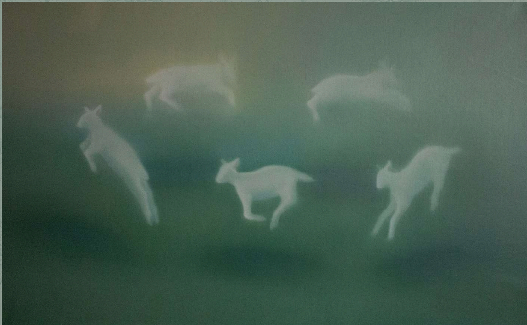
Owieczki, 2026 olej na płótnie 80 x 130 cm