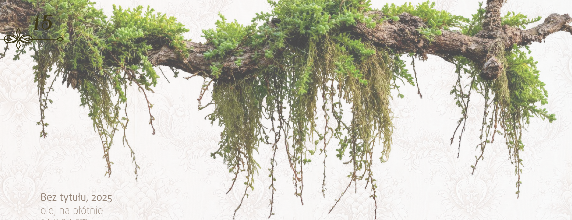
Bez tytułu, 2025 olej na płótnie 14 x 24 cm