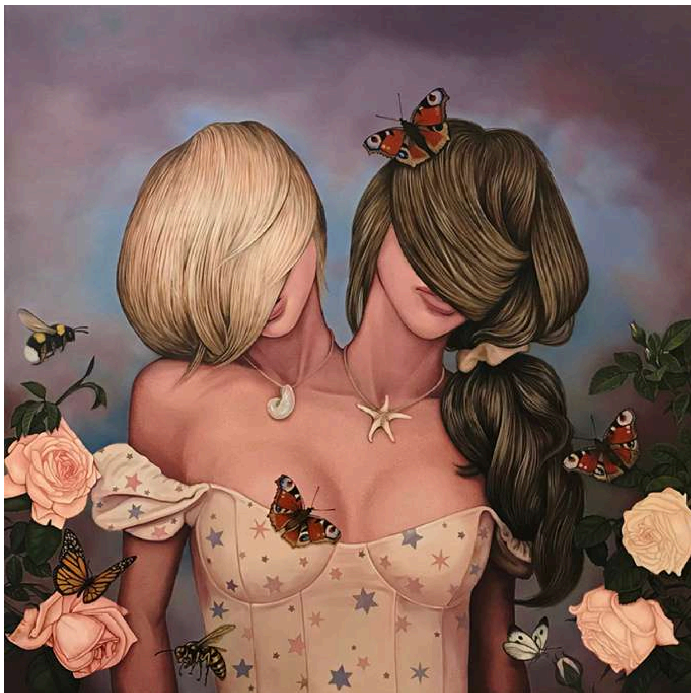
Lady in the Rose Garden Dama w różanym ogrodzie