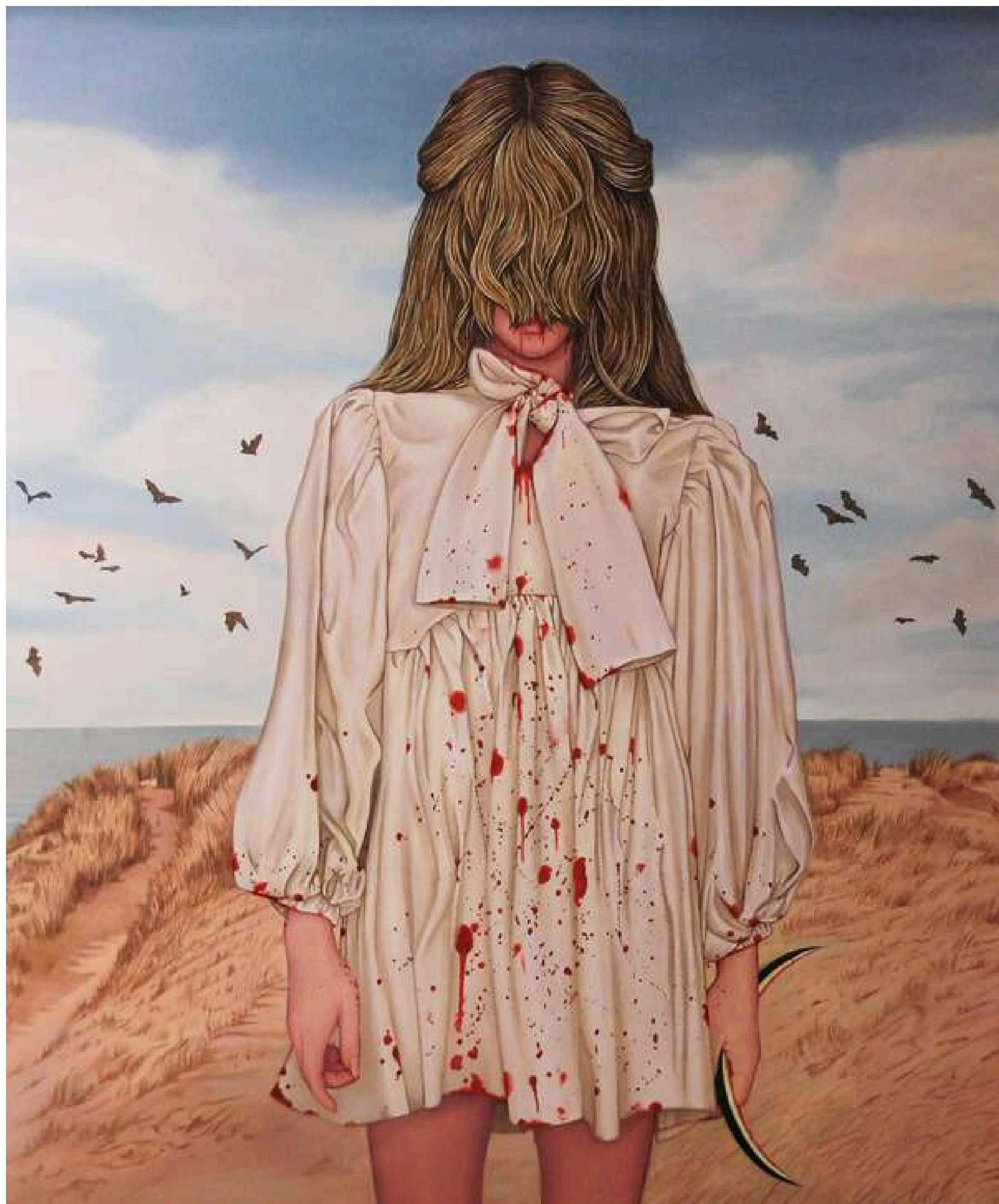
Lady with a watermelon Dama z arbuzem