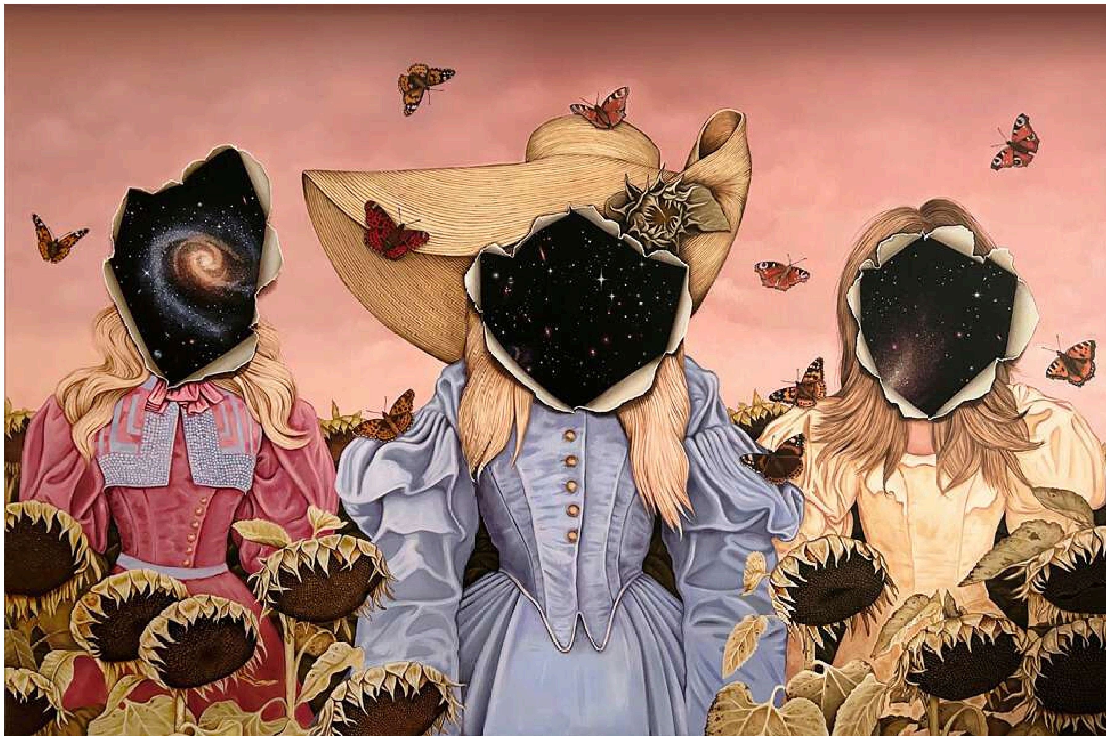
Ladies in Sunflowers Damy w słonecznikach