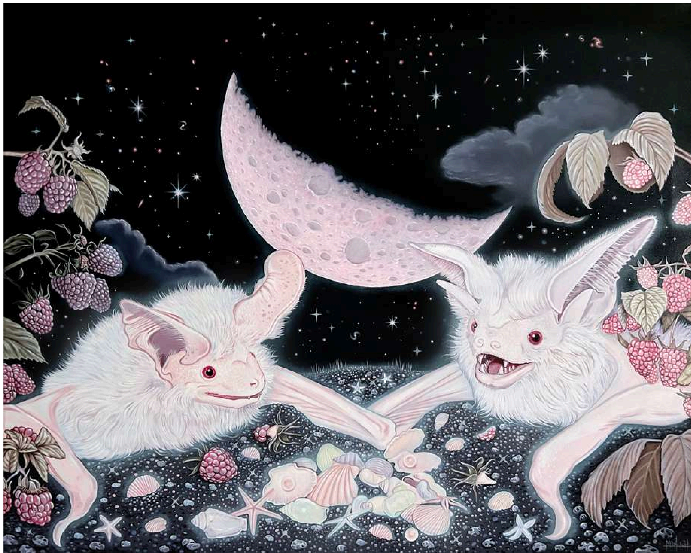
Nightly Rendezvous Nocne spotkanie