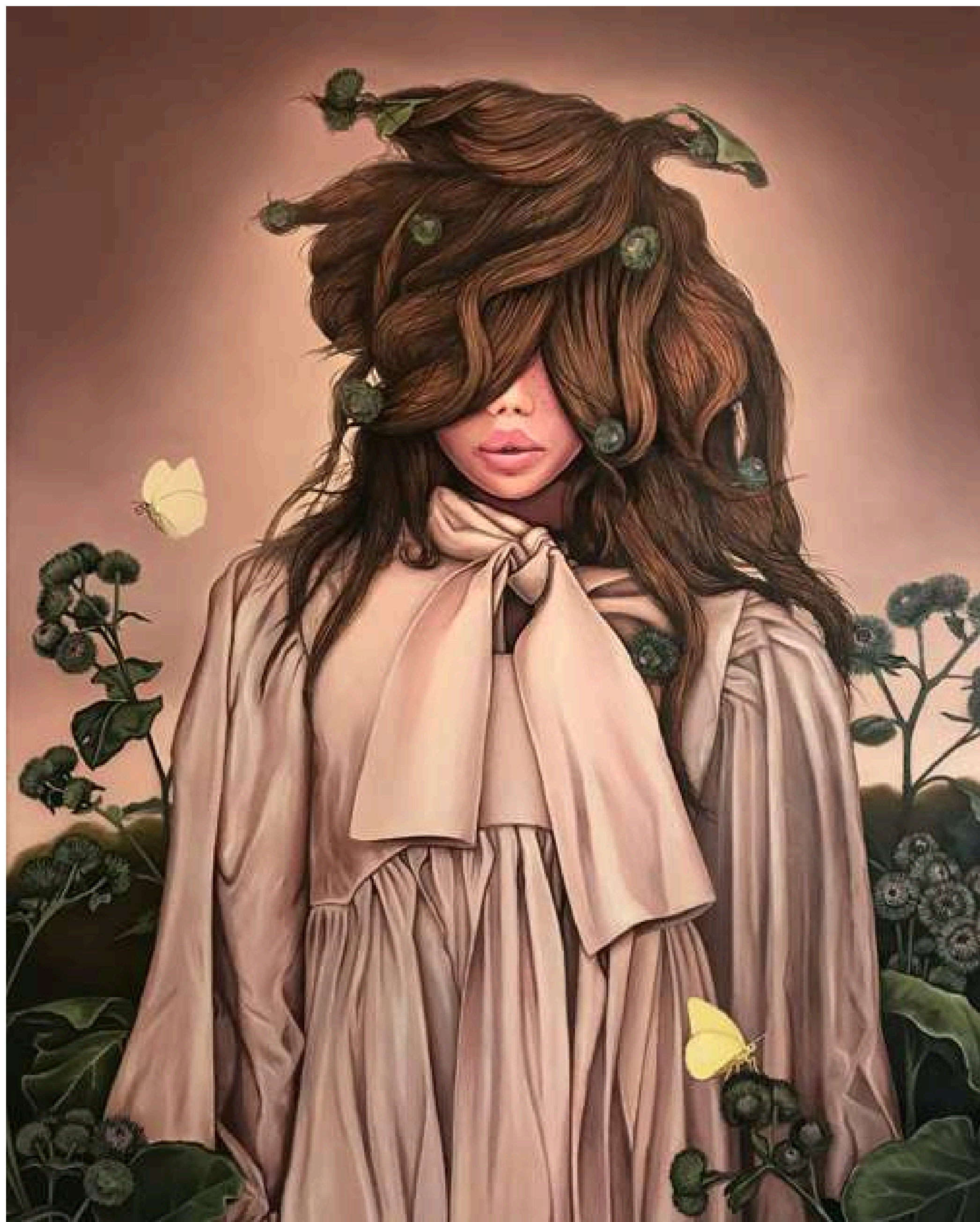
Lady with a Burdock in Hair Dama z rzepami w włosach