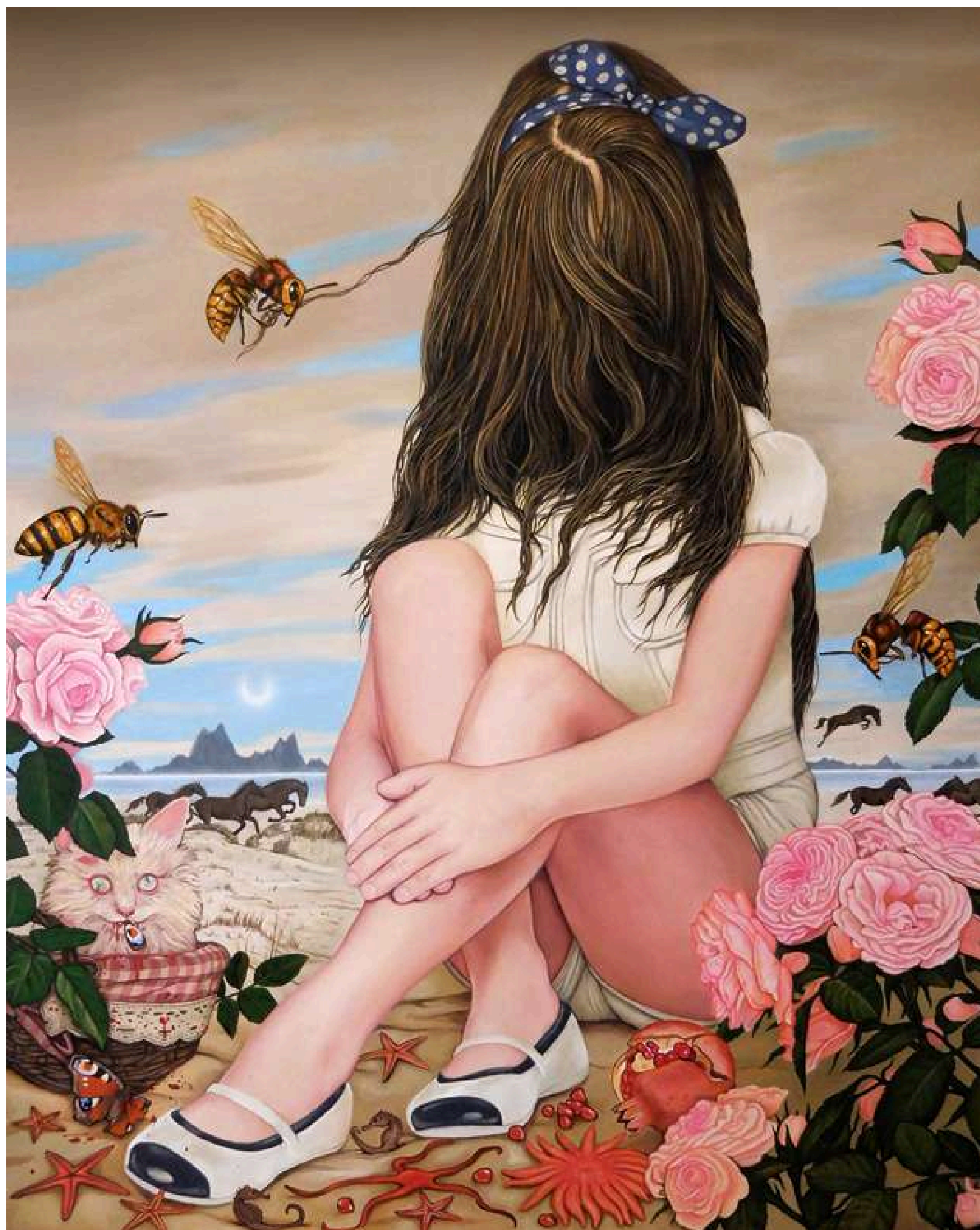
Secret in the Rose Garden Sekret w różanym ogrodzie