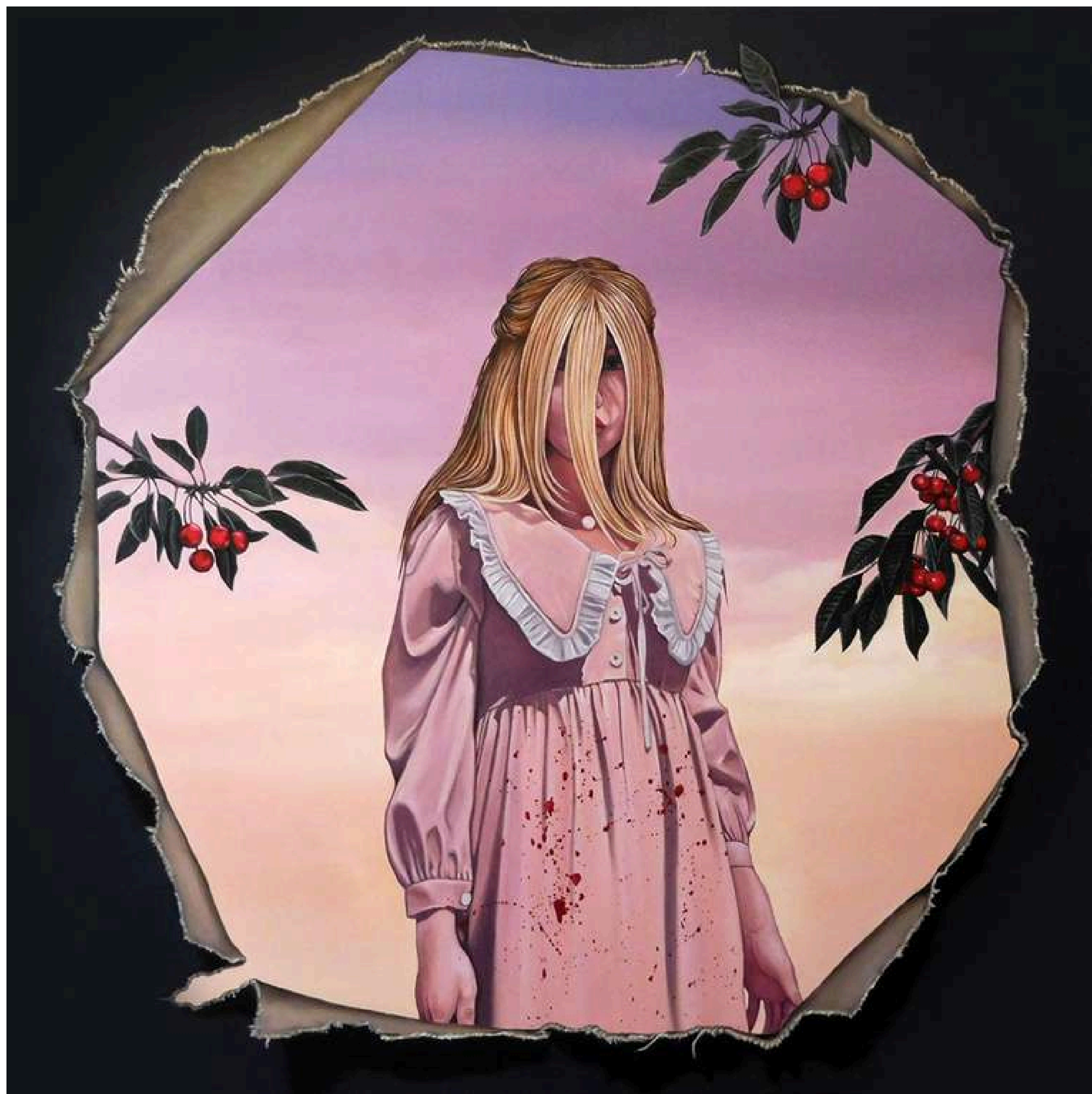
Lady in the Cherry Garden Dama w wiśniowym ogrodzie