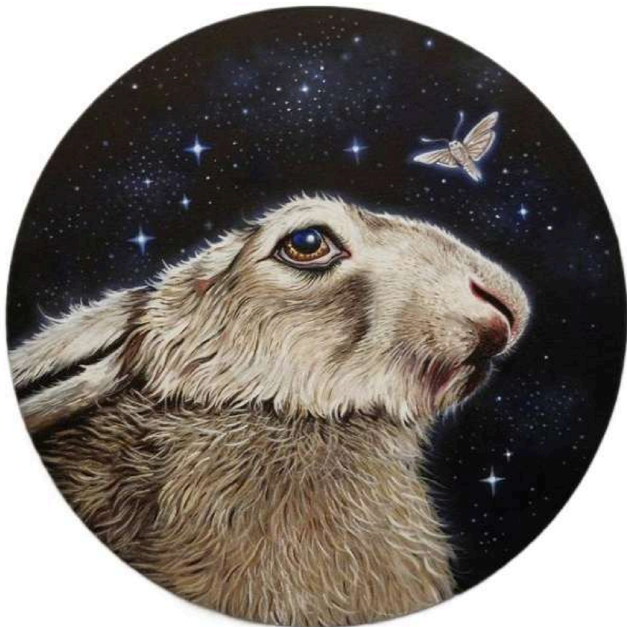
Cosmic Hare Kosmiczny zajac