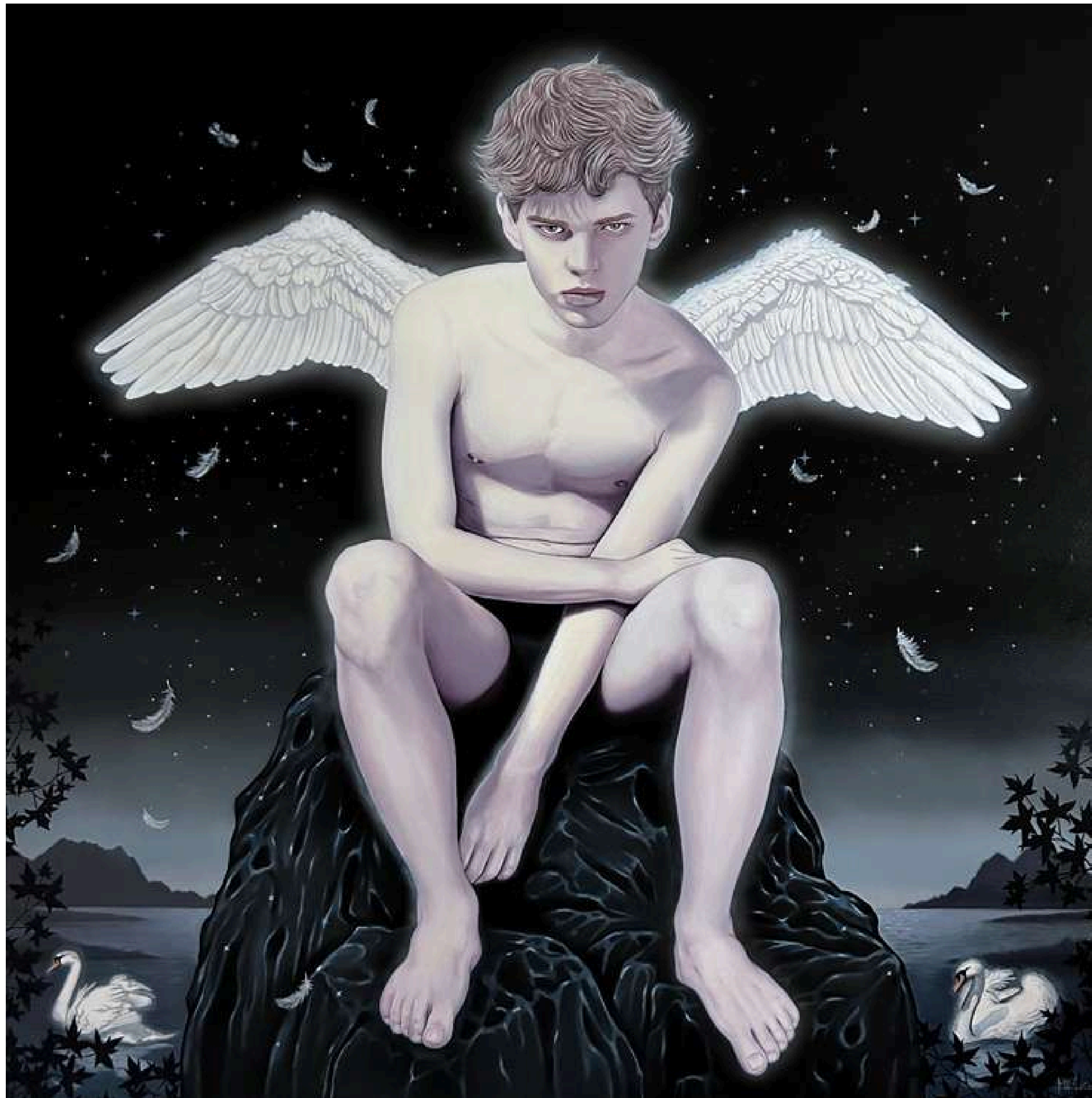
King of the Night Król nocy