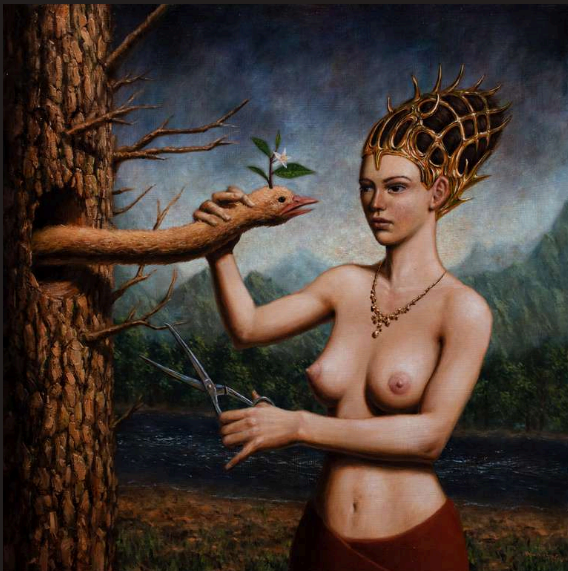
Dylemat Zephyry, 2023