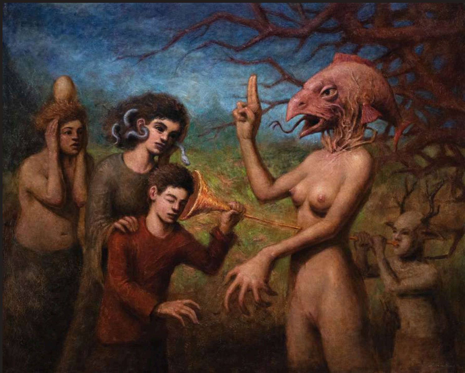
Poszukiwanie wyznawców, 2024