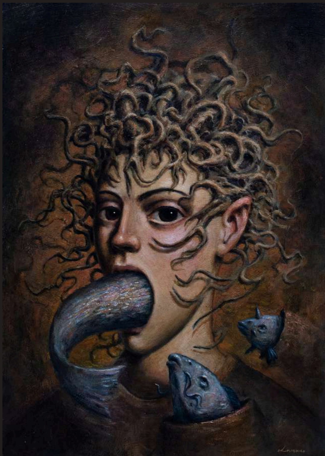
Znowu jakiś chłop ma rybę w gębie, 2024